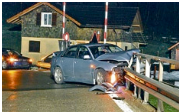
Der Neulenker landete beinahe in der Kleinen Emme. LUZERNER POLIZEI

SCHACHEN. Ein 18-jähriger Neulenker ist am Montagabend mit seinem Auto in einer Kurve in Schachen geradeaus gefahren und in einer Leitplanke gelandet. Diese verhinderte, dass der Lenker und seine beiden Mitfahrer in die Kleine Emme stürzten. Alle Insassen blieben unverletzt.