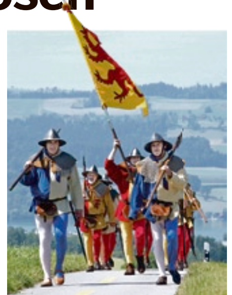
Sempach: So sah der Umzug bisher aus.